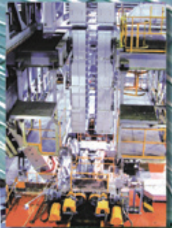
託聞工場めっき設備