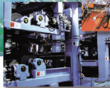
託聞工場ロールコーター